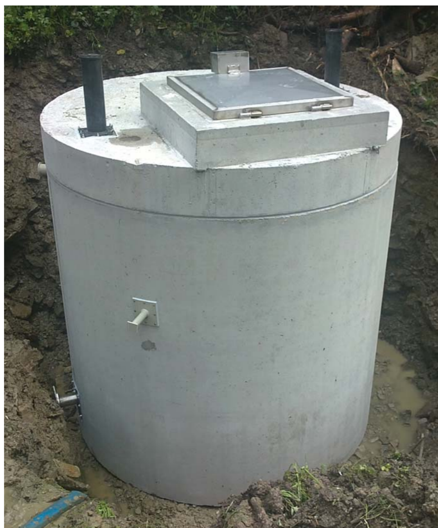
Typová hala – Velké Bílovice

Manipulační prostředky na požádání zapůjčíme.